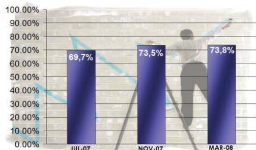
Evolución del Índice de Confianza Económica (Julio de 2.007 a Marzo de 2.008)

Se puede observar un crecimiento desde Julio del año pasado hasta Marzo del corriente año. Por más que haya escasa diferencia entre Noviembre de 2.007 y Marzo de 2.008, sigue habiendo un aumento.